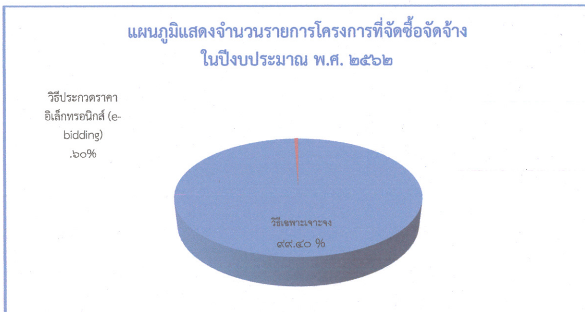
ตารางที่ ๒ แสดงจำนวนรายการที่ดำเนินการตรวจรับและเบิกจ่ายแล้วเสร็จ ในปีงบประมาณ พ.ศ. ๒๕๖๒ จำแนกตามวิธีการจัดซื้อจัดจ้าง